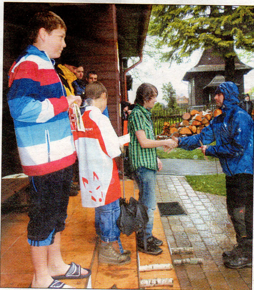
Ani liják při předávání cen nezmenšil radost z nich.

Kategorií bylo mnoho a se sluchátky na uších běhali nejen šedesátníci, ale i malé děti. Za to nadšení si zaslouží obdiv. A jak jsem je tak sledovala, je více než jasné, že za rok se budou po hrčavských lesích prohánět znovu.