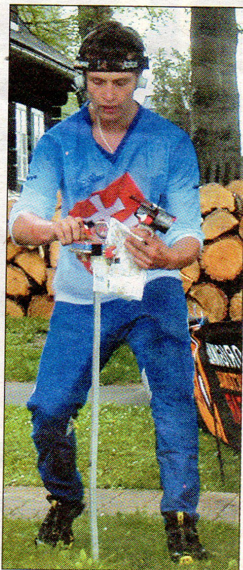
Pípnutím v cíli závod skončil.